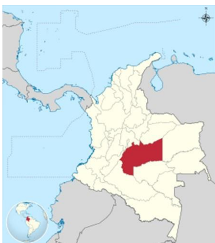
Departamento del Meta